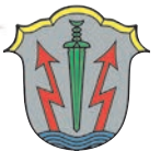
Marco Harrer Erster Bürgermeister