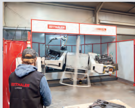
70 hochqualifizierte Mitarbeiter arbeiten täglich an modernen Anlagen wie unserem Schweißroboter (s. Bild), im Werk in Polling (Lkr. Mühldorf).