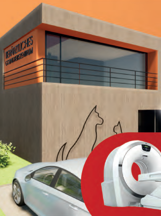
NORDANSICHT MIT BALKON